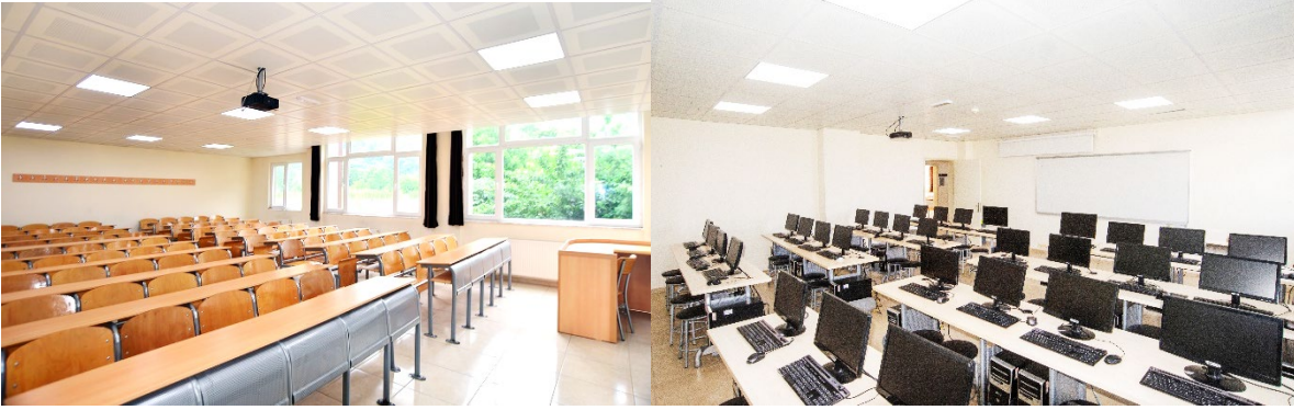
Şekil 3. Derslik ve Laboratuvarımız

Okulumuzda 10 derslik, 1 adet laboratuvar vardır.